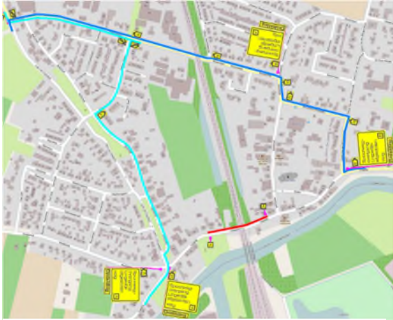
Afbeelding 2. Omleidingsroute autoverkeer.

bij hun woning komen onder begeleiding van één van onze verkeersregelaars én op vertoon van de bewonerspas. De omleidingsroute vindt plaats via de overweg Nieuwsteeg (zie afbeelding 2). Er is een hulpbrug gebouwd om de fietsbrug zo lang mogelijk bereikbaar te houden. Deze hulpbrug is vanaf donderdag 18 april 2019 07.00 uur afgesloten en gaat op woensdag 24 april 2019 om 17.00 uur weer open. De hulpbrug blijft in gebruik tot en met vrijdag 10 mei 2019. Omleidingsroute voor fietsers en voetgangers gaat via de rotonde N833 (zie afbeelding 3).